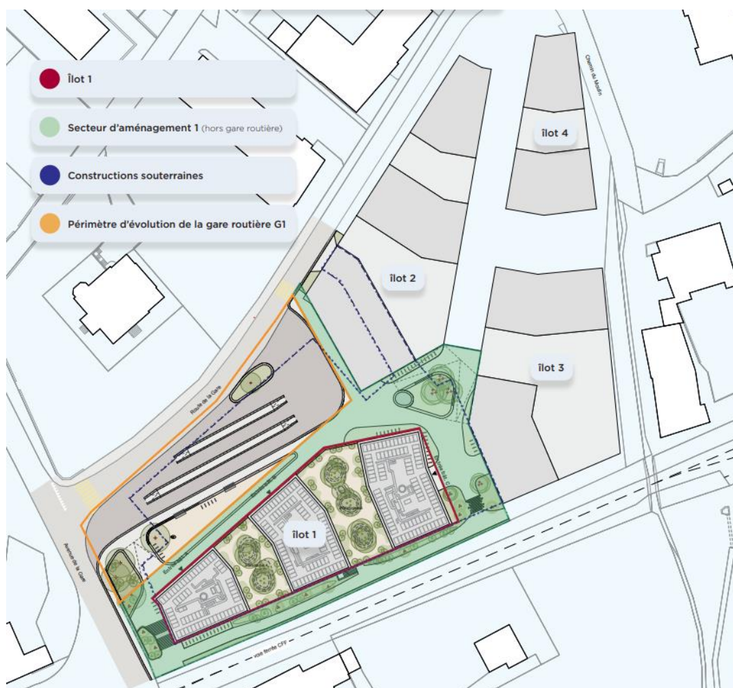
Localisation des îlots 1 à 4